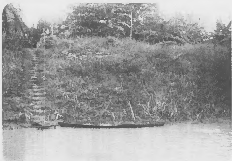
Fig. 2 . Aspecto de uma várzea estável do Médio Amazonas, com talude recoberto por gramínea nativa. Oriximiná, Estado do Pará.