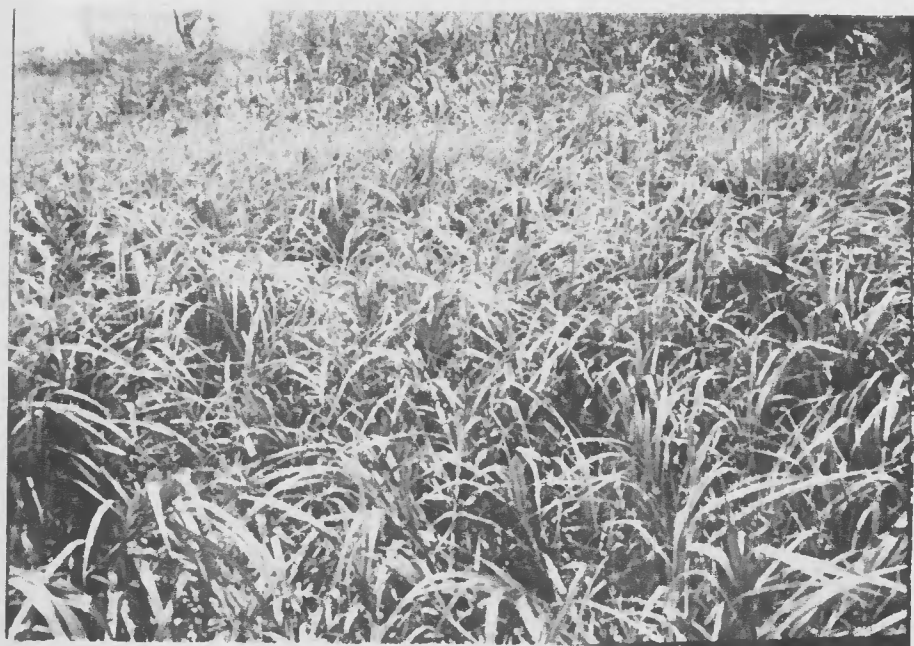
Fig.4 - Cobertura de vegetação secundária constituída por gramíneas, principalmente o muri Paspalum fasciculatum nas várzeas do Médio Amazonas.

A agricultura das várzeas do Médio e Baixo Amazonas, assim como daquelas do estuário, utiliza as terras estáveis mais altas, as que ficam mais próximas da margem dos rios, onde as culturas tornam-se mais viáveis e mais econômicas.