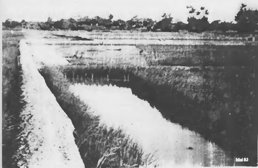
Fig. 7 - Área de várzea sistematizada às margens do rio Caeté, Município de Bragança, Estado do Pará.

O segundo sistema (Fig. 7), que utiliza área sistem tizada , compreende o represamento da água pelos diques, constru ídos manualmente com a forma trapezoidal, com 1,50m de base maior, 0,50m de base menor e 0,80m de altura média (1,12). Ne les a entrada da água se dá através do sistema de vasos comuni cantes por ocasião da preamar e a drenagem, por diferença de nível, por ocasião da baixamar. A formação da lâmina de água se dá por ocasião da maré lançante que ocorre, em média, de 15 em 15 dias. Neste sistema é possível retirar duas produções a nuais .