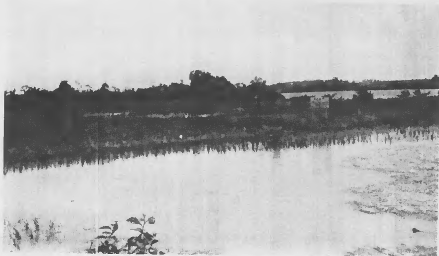
Fig. 3 - Aspecto da limpeza de uma área destinada à cultura do arroz, com a retirada do "mato" sobrenadante. Várzea do rio Caeté, Estado do Pará.