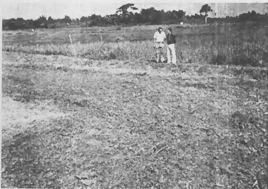
Fig. 5 - Preparo de área sem lâmina de água para a cultura de arroz de várzea.

Esta diferença de rendimentos em área de solos semelhantes (Solo Aluvial e Gleí Pouco Húmico) nos dois sistemas de manejo, tem levado a pesquisa a encontrar, dentro do sistema de baixa tecnologia, um sistema melhorado (com áreas sistematizadas) que possibilite uma melhor produtividade por área explorada. Nele, nas quadras sistematizadas, o preparo do solo é efetuado com auxílio de um micro-tractor que proporciona a mobilização do solo úmido após a roçagem da vegetação (Fig. 5), ao invés do sistema tradicional da região que preconiza para a área de solos hidromórficos o preparo do terreno com lâmina de água.