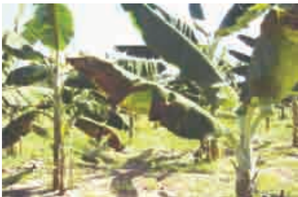
Figura 2 - Bananeiras com sintomas característicos de Sigatoka-negra Foto: Ruth L. Benchimol.

Até então, a Sigatoka-negra ainda não havia sido encontrada no Nordeste paraense, ficando restrita às regiões anteriormente citadas. Considera-se que ainda não está disseminada por todo o Estado devido, principalmente, à restrição de trânsito de bananas provenientes de áreas onde a doença já existe.