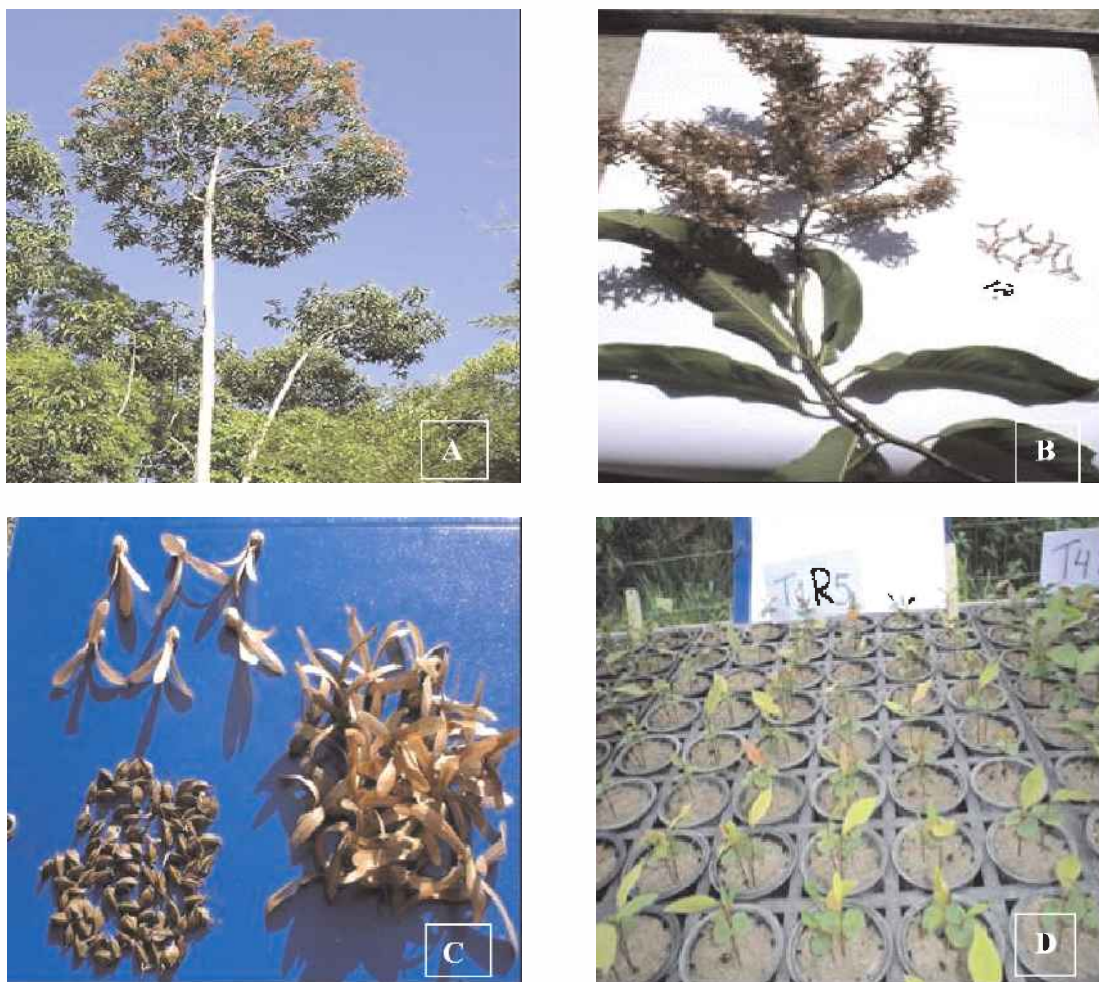
Figura 1- Vista geral da árvore adulta (A), ramo com fruto (B), sâmaras (C) e plantas jovens (D) de Triplaris surinamensis Cham (Tachi preto da várzea). Foto: Leonilde Rosa, 2005.

Cada árvore é capaz de produzir milhares de sementes polygonadas a cada período de frutificação, o que torna esta espécie potencial para recuperação de áreas degradadas, especialmente para a recuperação de matas ciliares.