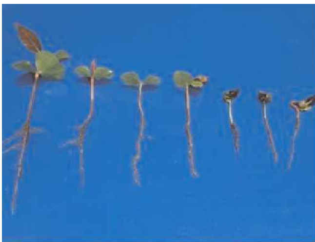
Figura 2 - Aspectos da germinação e do desenvolvimento de plântulas de Triplaris surinamensis Cham. (Tachi preto da várzea). Foto: Leonilde Rosa, 2005.

A germinação das sementes de tachi preto da várzea ( Triplaris surinamensis Cham) é epígea fanerocotiledonar com germinação curvada. Os eófilos são simples, opostos e apresentam formato diferente das folhas da planta adulta. Detalhes da germinação e do desenvolvimento de plântulas podem ser visualizados na Figura 2.